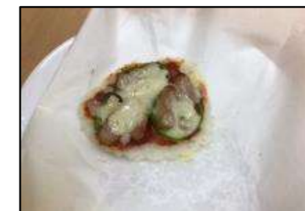
▲ライスピザ作り(豊島区)