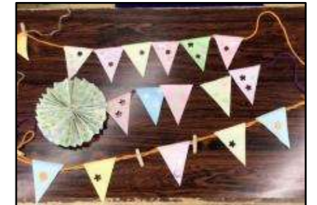
▲ガーランド作り(板橋区)