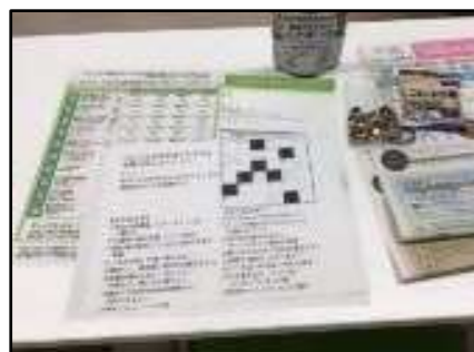
▲セルフ認知症チェック(文京区)