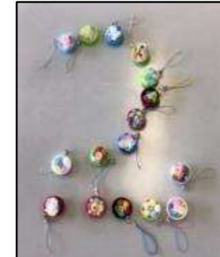
▲ペットボトルキャップで ストラップ作り(北区)