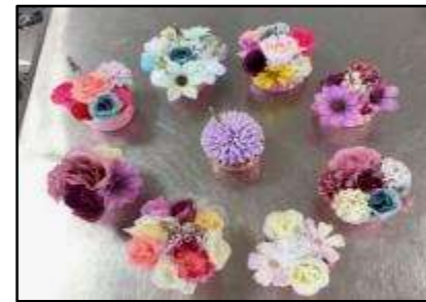
▲造花のメモスタンド(荒川区)