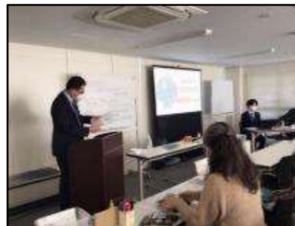
▲ゴミ分別講座(板橋区)