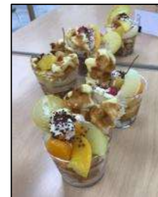
▲トライフル作り(豊島区)