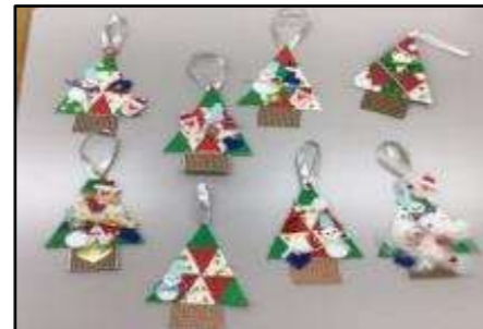
▲オーナメント作り(足立区)