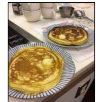
▲ホットケーキ食べ比べ(北区)