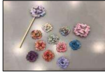
▲折り紙でコサージュ(荒川区)