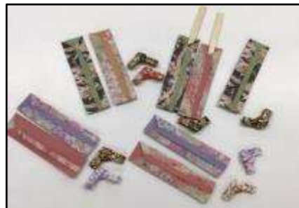
▲折り紙で箸置き(文京区)