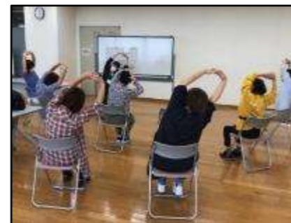
▲座ってできるおうち体操(足立区)