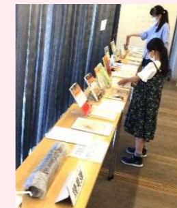
平和の本紹介と焼夷弾(実物展示)