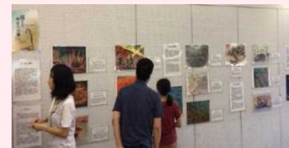
体験者の描いた空襲体験画の展示