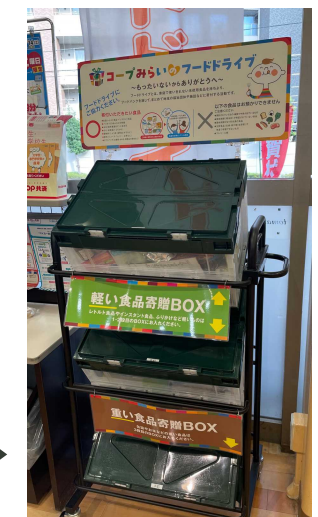
痛いほどトゲトゲな新鮮きゅうり ▶ ▲畑との中継 ▼巨大冷蔵倉庫 店舗内に設置してあるフードドライブコンテナ ▶