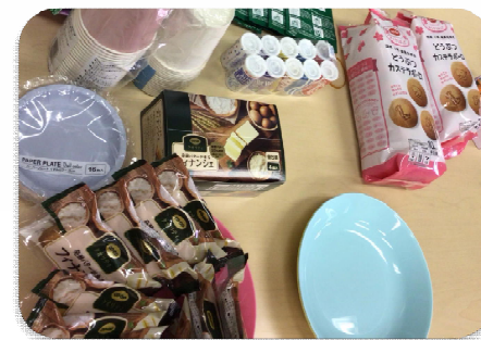
～試食品～ どうぶつカステラ ポーロとフィナンシェ