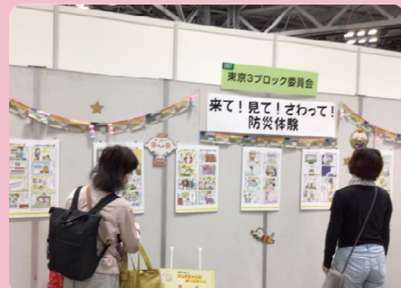
「4コマ漫画が面白くて防災を考えるよい機会になりました」等々、多くの方に感想を書いていただきました。