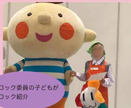
ブロック委員の子どもがブロック紹介