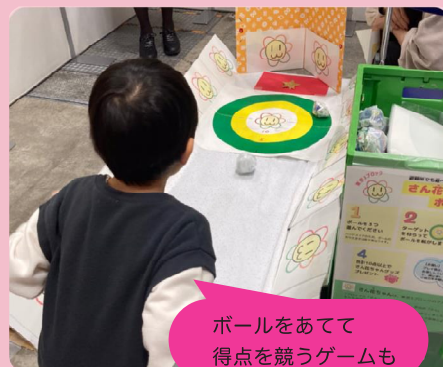
ボールをあてて得点を競うゲームも

誰でも参加できる地域の集いの場 「みらい」ひろばは、新しい発見や学び、地域の方との出逢いの場として親しまれています。みなさまのご参加をお待ちしています。 みらいひろば 2月 参加は月に1人1回まで 申込は不要です。 開始時間までに直接会場にお越しください。 なお会場の定員を超えた場合は、先着順となります。 参加費無料 商品販売 動議なし くコープみらいの企画、みらいひろばに参加される方へのごお願い *活動の様子や風景を撮影し、その写真や動画を広報のために SNS 等に掲載させていただく場合があります。*みらいひろばはお近くの会場にご参加ください。*お預かりした個人情報は、お申し込み受付、資料・ご案内送付、その他ご連絡が必要な場合に使用します。*当日はゴミ袋、筆記用具、必要な方は飲み物をお持ちください。*みらいひろばはお子さん同伴可です。*喉の痛み、倦怠感などの症状がある場合や、体調に不安がある場合は、ご参加をお控えいただきますようお願いいたします。*内容は変更になる場合があります。*試食の際は、手洗いにご協力をお願いします。*企画は今後、不測の事態によって、開催を見送る可能性があります。詳しくは1ページ記載の参加とネットワーク推進部にお問い合わせください。*このニュースは当日まで保管ください。