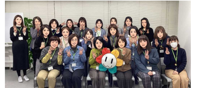
▲退任するブロック委員も含めて全員で集合写真を撮り、イラストにしてみました。