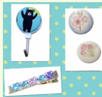
素敵な作品ができました