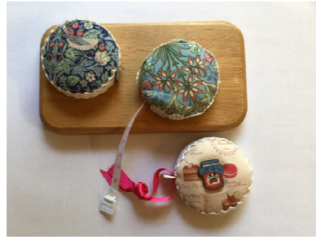
♥写真はイメージです♥

今回は、みらいひろばの企画で人気の高かった デコレーションメジャーを作ります🐱 お気に入りの布やレースでデコレーションした メジャーは、可愛いだけではなく、ちょっと サイズを測るときにとっても便利なお役立ちグッズですよ。