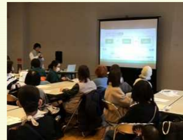
基礎から学べる充実の内容

「片付かないを卒業！」をテーマに整理収納アドバイザーの先生よりコツを伝授。基本から実践まで幅広い内容に、「とても役にたった！」「早速始めてみたい」「もっと聞きたかった！」と大好評でした。