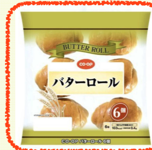
ふんわり食感で大人気