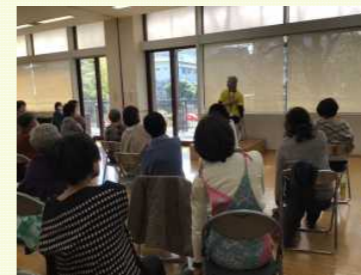
笑顔で楽しく体をほぐしました

お話上手なコープみらいカルチャーの講師の先生。笑いの絶えない和やかな雰囲気の中、体をやさしくほぐす「ゆる体操」を体験。「体がポカポカに！」「簡単に続けられそう」「脱力って意外と大事」「動きやすくなってびっくり！」その場で効果を実感する声も多く、こころも体もリラックスできる時間となりました。