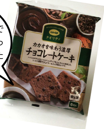
カカオを味わう濃厚 チョコレートケーキ