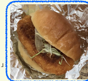
コロッケをはさみました

ロールパンサンドやジャムのセクラッカー、お茶をご用意→「しょっぱいのと甘いのがバランスが絶妙！」「満足感あり！」「素材が美味しい」との感想多数！