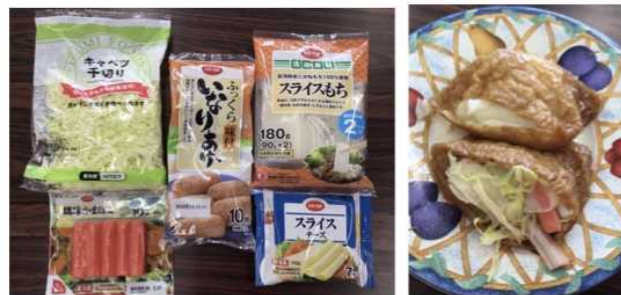
コープふくらみ味付いなりあげ アレンジレシピ