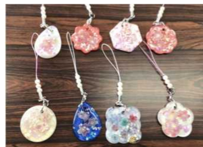
UVレジンで桜ストラップ