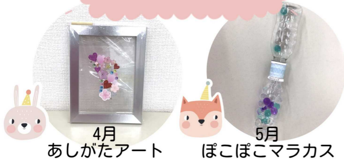
4月 あしがたアート