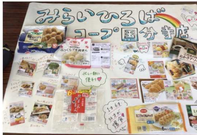
おすすめコープ商品

みらいひろばとは、暮らしに関わる様々なことや、コープのことを楽しく学ぶことができる、地域の交流の場です。コープ商品を真ん中に、世代を超えて楽しくおしゃべりしませんか？2025年度のみらいひろばの様子を紹介します♪