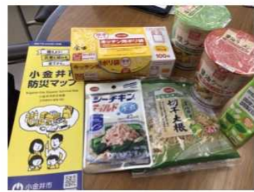
おためし防災食とお役立ち小物