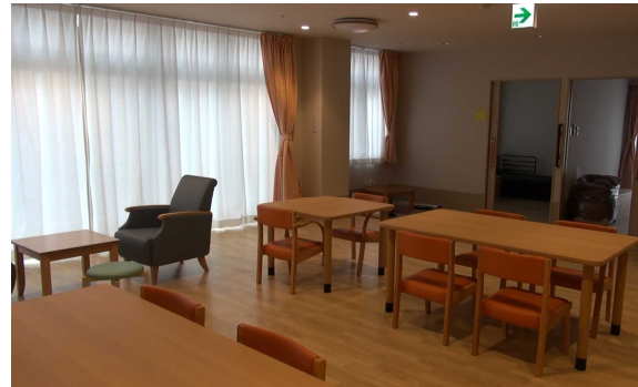
「通い」を行うスペース