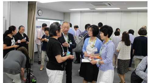
昨年の活動交流会の様子 団体の発表(上)、交流会(下)