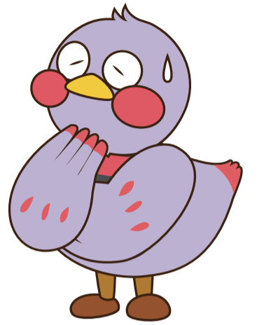
埼玉県マスコット「さいたまっち」