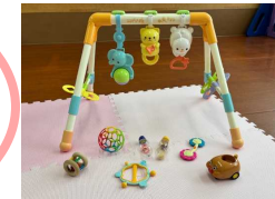
赤ちゃんおもちゃ