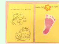
すくすくカード見本