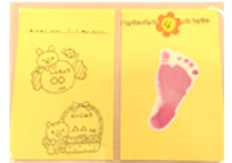
【すくすくカード見本】