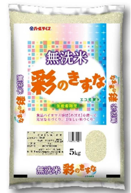
『無洗米 彩のきずなエコ循環米』

※店舗などから出る食品残さを堆肥に活用した地産地消の取り組みは、埼玉産直センター(深谷市)や川越地域生協出荷組合(川越市)の産直野菜でも行っています。