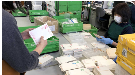
届いたはがきや切手などの集計作業

コープみらいでは、組合員とともに、今後ともSDGsが目指す「誰一人取り残さない」持続可能な社会の実現に向けて様々な活動を支援してまいります。